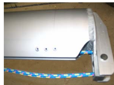
Passage de la nouvelle drisse