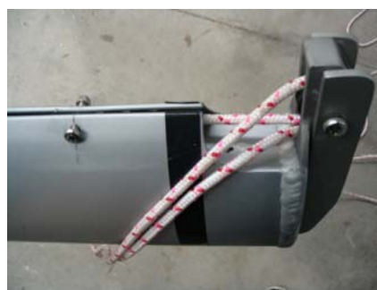
Mouflage en oeuvre

ATTENTION : VERIFIER REGULIEREMENT L'USURE DU BOUT EN TETE DE MAT