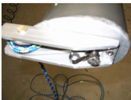
Montage du pontet à œil