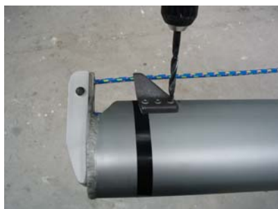
Démontage de la platine du Hook